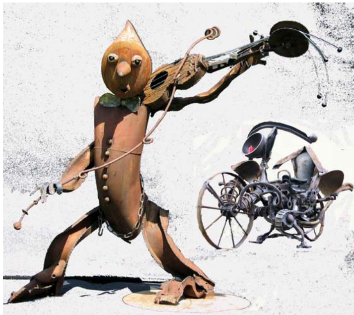
Der stille Geiger und sein der heißer Ofen