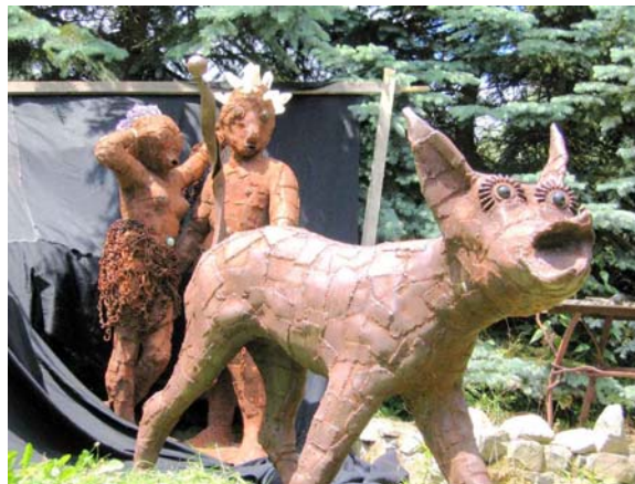
Pair of lovers