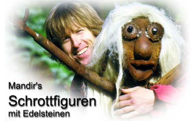
Mandir's Schrottfiguren mit Edelsteinen