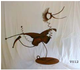
Das liebe Vieh und die Feder-Kopf-Spess-Vögel